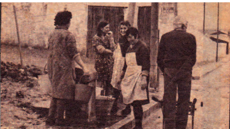
BARRIO DE VILANOS.